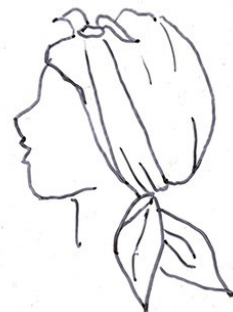
En klut knuten med liten knut på hjässan. Behöver vara ca 90x90 cm.

Huvudbonaden visade graden av högtid men framförallt var den en symbol för uppnådd värdighet. Den gifte mannen markerade sin husbondevärdighet genom att bära hatt och käpp. Som ung och i vardagslag hade han en rundkullig hätta sydd av 5-6 tygkilar.