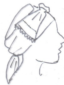
bandklyt M 271

Även under den mjuka mössan kan en krans användas för att fylla ut. Under den hårda bindmössan sätts håret upp i en knut mitt i mösskullen eller i nacken så att knuten kommer nedanför mössan. Håret kommer då att döljas av bindmössans sidenrosett. Strykband används även under mössa och stycke. Det stärkta stycket ska inte sys fast i mössan utan läggas slätt över håret och fästas bak. Ovanpå det sätts bindmössan.