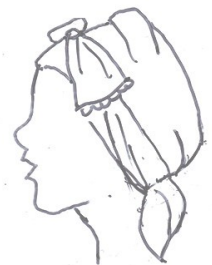
bandklut M 4335

På målningar från tiden då dräkterna bars har kvinnorna i Värendsområdet klutarna knutna på flera sätt. På tidiga avbildningar är kluten en diagonalvikt kvadratisk duk knuten över tyget i nacken. Den kan också vara korsad över tyget och knuten med en liten knut uppe på hjässan. Kluten bör då vara minst 90 cm i fyrkant. Senare när bandklutar kom på modet förlängdes ändarna med påsydda klutband som knöts på hjässan. Klutarna ska vara väl stärkta. Det finns mönster och sömnadsbeskrivningar till två mindre bandklutar. Det är inte känt vilken klutmodell som burits till de olika dräktvarianterna. Här får man göra sitt eget val.