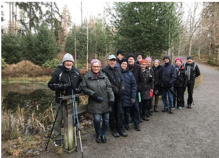
Bild från Linnés Arboretum, Teleborg 17 nov.

Under hösten har vi fortsatt med våra promenader. Vi har besökt lite olika platser i vårt närområde, exempelvis Nylandaområdet, Bergunda, Bredvik-Bergsnäs, Bäckaslöv, Stora Pene, Sjöudden-Bastanäs, Telestadshöjden, Trummen, Linnés Arboretum. Startplatser förmedlas veckovis via hemsidan. Antal deltagare har varierat mellan 9 och 16. Efter någon timmes promenad avslutar vi med medhavd fika. Det brukar bli en trivsamt stund.