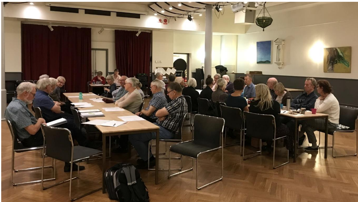
Föreningsmöte den 17 oktober.