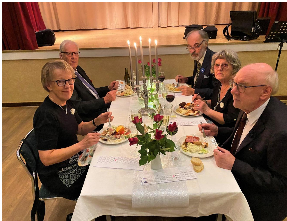
Jubilarerna vid årets nollfest